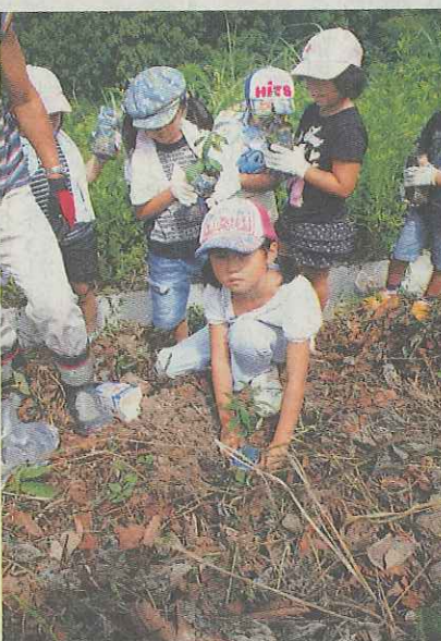
ドングリの苗木を植樹する子どもら＝下呂市御厩野、小笹広場